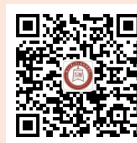
学院招生服务平台